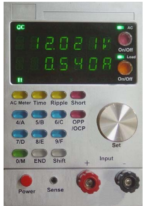
尺寸(mm): 160 高 × 110 寬 × 380 長